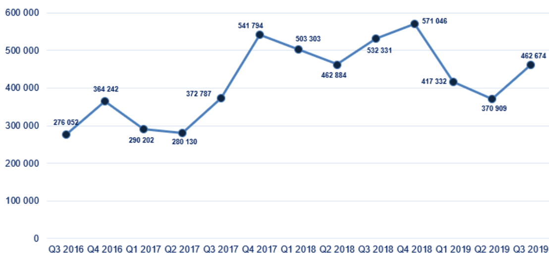
Sezonowość i cykl wzrostu przychodów ASBIS pomiędzy III kw. 2016 r. a III kw. 2019 r. ( w tys. USD)

Zysk brutto: Zysk brutto wzrósł zarówno w III kw. 2019 jak i za dziewięć miesięcy 2019 w porównaniu do analogicznych okresów 2018.